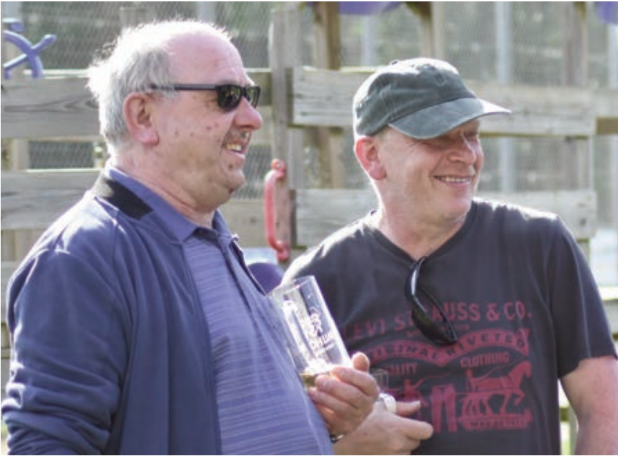
Fans * Fans * Fans * Fans