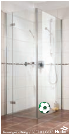
Raumgestaltung / BEST IN GLAS Heiler

Kreative Gestaltung mit Fliesen und Natursteinen barrierefrei, senioren- und behindertengerecht im Innen- und Außenbereich