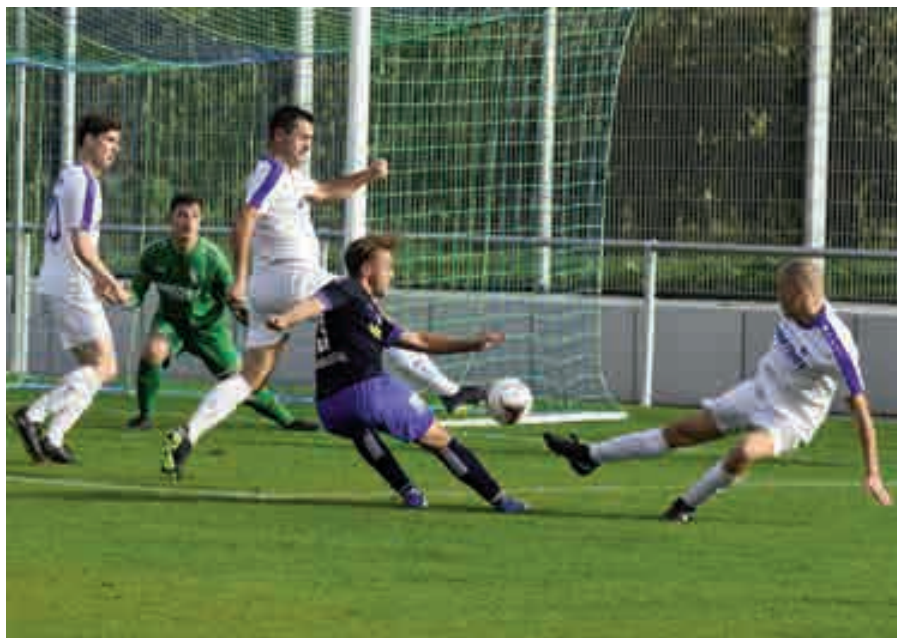
(gw) Lange umkämpft war das Hinspiel beim SC Durbachtal, wo unsere „Erste“ beim 2:2 einen Zähler entführen konnte und am Ende nur knapp einen Dreier verpasste.