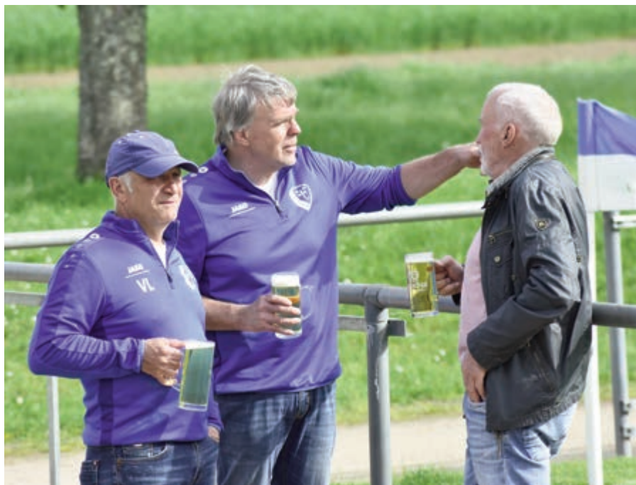
Fans * Fans * Fans * Fans